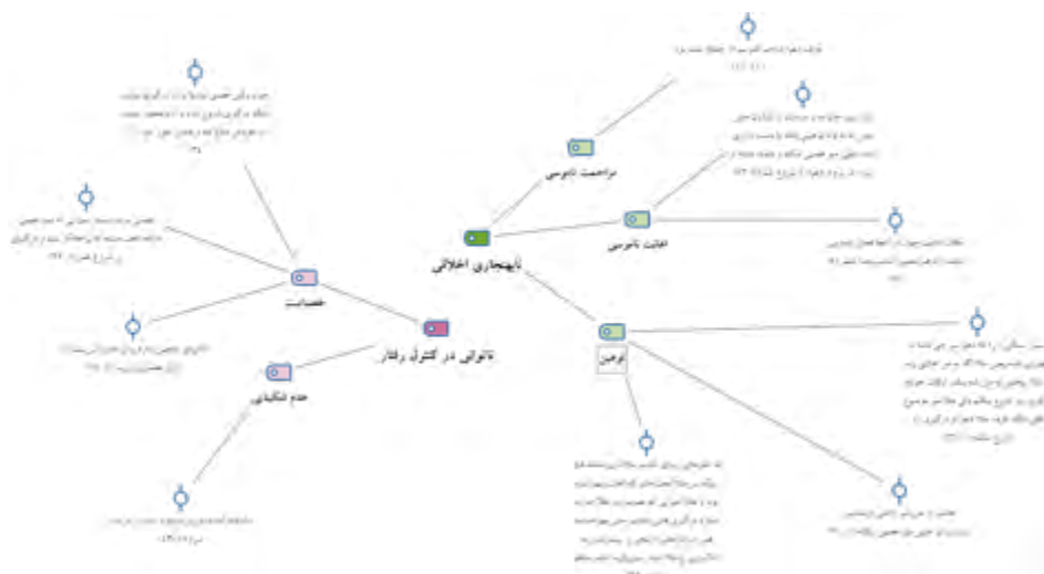
شکل شماره ۲: نحوه مفهوم‌بندی و مقوله‌بندی درگیری و نزاع فردی

در مرحله مقوله‌بندی نیز بر اساس تکنیک مقایسه، مفاهیم بررسی شدند و مفاهیم مشترک در ذیل مقوله‌های معین قرار گرفتند. در شکل شماره ۲ نیز نمونه‌ای از مفهوم‌بندی و مقوله‌بندی داده‌ها در نرم‌افزار Maxqda نشان داده شده است.