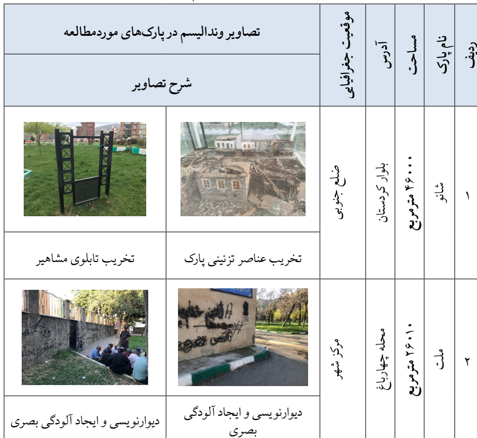
جدول شماره ۱. مشخصات و مصادیق وندالیسم در پارک‌های مورد مطالعه

قلمرو مکانی پژوهش، شهر مریوان واقع در غرب استان کردستان و سومین شهر پرجمعیت این استان جمعیتی بالغ بر ۱۴۰ هزار نفر و سرانه فضای سبز قریب به ۸ مترمربع دارد. شهر مریوان در مجموع دارای ۴۳ پارک خطی (حاشیه‌ای)، محله‌ای، منطقه‌ای و شهری است (آمارنامه فضای سبز مریوان، ۱۴۰۲). محدوده مطالعاتی این پژوهش، پارک‌های عمومی شهر مریوان و نیز استفاده‌کنندگان از آن است. در انتخاب پارک‌های مورد مطالعه سعی شد از میان پارک‌های موجود در شهر مریوان، ۸ پارک با پراکنش مختلف در سطح شهر انتخاب گردد. مشخصات پارک‌ها در جدول شماره ۱ آمده است.