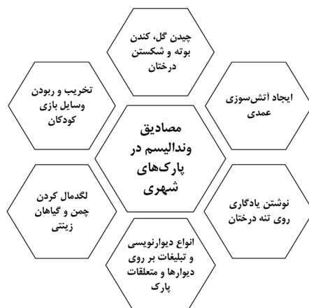
شکل شماره ۱: مصادیق رفتارهای وندالیستی در پارک‌های شهری

تخریب اموال عمومی و وسایل عام‌المنفعه یکی از مصادیق جرائم علیه امنیت و آسایش عمومی است؛ در این راستا، مطابق قانون مجازات اسلامی (تعزیرات) مصوب ۱۳۷۵ هر نوع نهب و غارت و اتلاف اموال و اجناس و امتعه یا محصولات که از طرف جماعتی بیش از سه نفر به نحو قهر و غلبه واقع شود، چنانچه محارب شناخته نشوند به حبس از دو تا پنج سال محکوم خواهند شد. همچنین مطابق قانون حفظ و گسترش فضای سبز در شهرها مصوب ۱۳۵۹، قطع هر درخت موضوع این قانون یا فراهم کردن موجبات از بین رفتن آن به صورت عالمماً و عامداً، علاوه بر جبران خسارت از سوی مرتکب، مستوجب جزای نقدی از پنج میلیون ریال تا چهل میلیون ریال برای قطع هر درخت است و در صورتی که قطع درخت بیش از سی اصله باشد، حبس تعزیری از شش ماه تا سه سال تعیین خواهد شد.