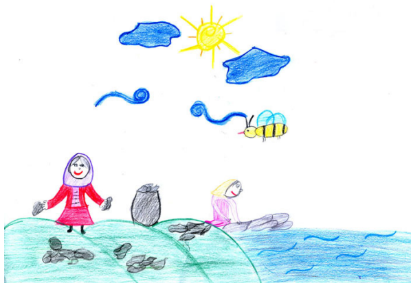
تصویر شماره ۲: توصیف گردش و تفریح و مکان‌های دوست‌داشتنی توسط کودک ۸ ساله در محله بیمه