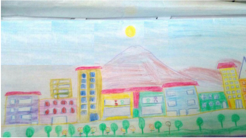
تصویر شماره ۱: توصیف محله در محله نازی آباد توسط کودک ۷ ساله