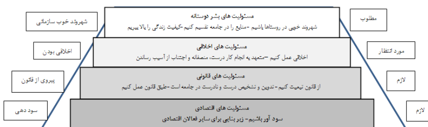
شکل ۱. هرم مسئولیت اجتماعی کارول