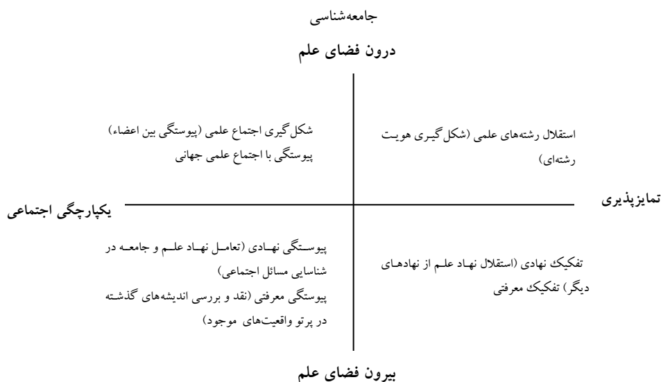
شکل ۱. ترکیب دو ویژگی ساختاری و معرفتی تمایزپذیری و یکپارچگی در درون و فضای بیرون

است. اما برای دستیابی به مدل پیشنهادی مقاله نمی‌توان تنها به این نظریات استناد کرد، زیرا ممکن است شرایط جامعه ایران یا جامعه‌شناسی در ایران با جوامع دیگر یا علوم دیگر متفاوت باشد. بر این اساس برای تبدیل مفروضات به شاخص، در ادامه اسناد حاصل از مصاحبه با صاحب‌نظران جامعه‌شناسی مورد تحلیل قرار می‌گیرد تا مدل پیشنهادی مورد نظر از اتقان بیشتری برخوردار شود.