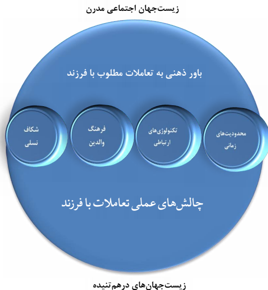
شکل شماره ۲: طرح‌واره نظری پژوهش

در طرح‌واره نظری (شکل شماره ۲) با استفاده از نیم‌دایره‌هایی برای تعریف زیست‌جهان‌های مدرن و درهم‌تنیده و دایره‌هایی برای نشان دادن عوامل تأثیرگذار بر شکاف ارتباطی والدین و فرزندان، چگونگی مسیر و فرایند آن ترسیم شده است.