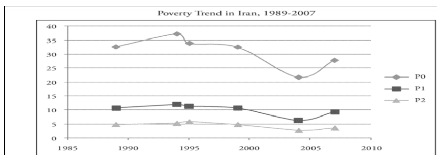
نمودار ۱. روند فقر در ایران

به‌لحاظ منطقی، با افزایش شاخص توسعه انسانی پیش‌بینی می‌شود که شاهد کاهش فقر باشیم و نمی‌توان صرفاً به شاخص توسعه انسانی برای بررسی روند بهبود اشاره کرد؛ چراکه اگر قرار بود این شاخص روند صعودی را طی کند شاخص فقر سیری نزولی را نشان می‌داد. حال آنکه، این شاخص ابتدا مسیری کاهنده و سپس فزاینده را در پیش گرفته‌است. بنابراین، شاخص توسعه انسانی در کنار شاخص مهمی چون فقر انسانی باید بررسی شود و نمی‌توان به شاخص توسعه انسانی به‌منزله یگانه شاخص قابل اعتماد برای نشان دادن سطح رفاه و بهبود زندگی افراد اشاره کرد.