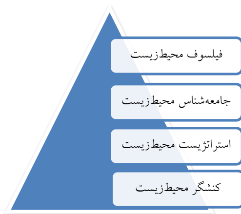
شکل ۳. فرآیند کشف، پژوهش و اجتماعی کردن مسائل زیست‌محیطی منبع: کلاهی، ۱۳۹۵

آن اشتباه شده و زحمتی برای مردم ایجاد کند). ۲- پدیده‌ای جدی، شایع و گسترده باشد (به عبارتی در کنار مورد اول یعنی منفی بودن، فقط مشکل یک عده کمی از افراد نباشد، بلکه تعداد بسیاری از افراد را درگیر کند). ۳- امید به ارائه راه‌حل و رفع مسئله (به عنوان مثال مرگ یک پدیده منفی (شرط اول) و شایع (شرط دوم) است، اما یک مسئله اجتماعی نیست چون کسی نمی‌تواند آن را تغییر دهد). ۴- امکان تغییر منطقی (بحث هزینه‌فایده تغییر و اجرای راه‌حل‌ها منطقی باشند). اما در مقام عمل چه کسی یا نهاد یا سازمانی این وظیفه (اجتماعی کردن مسائل زیست‌محیطی) را برعهده دارد؟ شکل شماره (۳) فرایند سه‌مرحله‌ای کشف، پژوهش و اجتماعی کردن مسائل زیست‌محیطی را نشان می‌دهد: