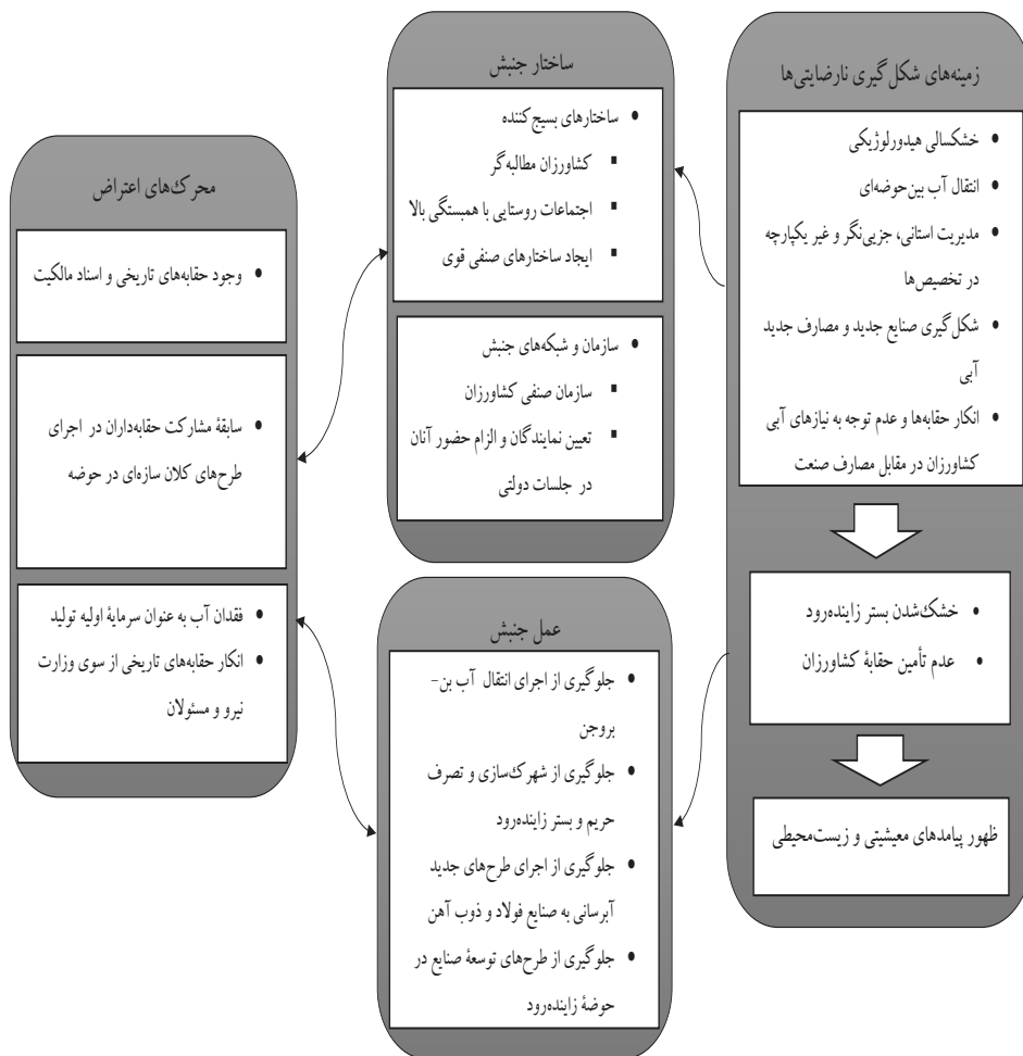
شکل شماره ۲: بازشناسی ساختار و عمل جنبش